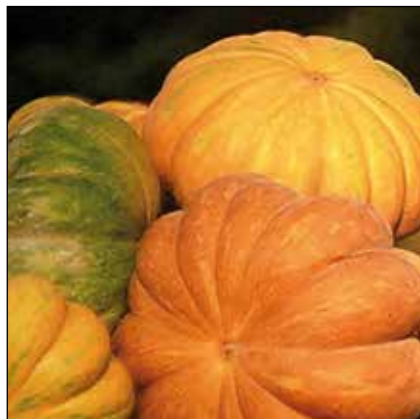
Муск де Прованс