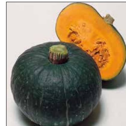
Свит Мама F1

Высокоурожайная тыква кустового типа. Формирует 2-3 крупных плода, предназначенных для хранения. Мякоть обладает выраженным ореховым вкусом