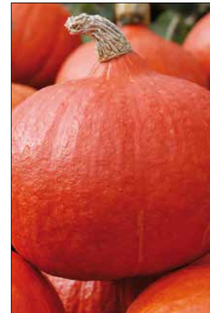
Оранж Саммер F1

Высокопродуктивный сорт японской тыквы с высокой энергией роста. Растение плетистое, формирует 2-3 плода на растении. Рекомендуется как для употребления в пищу, так и в декоративных целях.