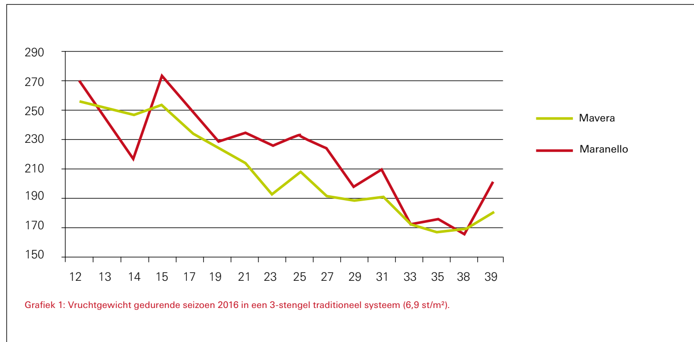
Grafiek 1: Vruchtgewicht gedurende seizoen 2016 in een 3-stengel traditioneel systeem (6,9 st/m²).

De vruchten van Maverera kleuren snel. Het eerste zetsel kan nog groen gesneden worden als de telers daarvoor kiest, maar bij latere zetsels zal dit lastiger zijn (dan bijvoorbeeld bij Maranello). Een belangrijk voordeel van Maverera t.o.v. andere rassen is de balans die het ras houdt in groei en zetting. Dit maakt het ras arbeidsvriendelijk en de kwaliteit in het voorjaar en zomer erg goed. Het ras is bijvoorbeeld erg sterk tegen oren. Het gemiddeld vruchtgewicht is vergelijkbaar met dat van Maduro en dus iets lager dan dat van Maranello. Grafiek 1 geeft een illustratie van hoe het vruchtgewicht zich kan ontwikkelen, maar dit zal variëren per jaar en teler.