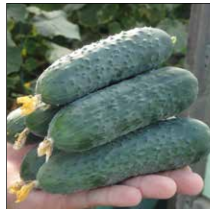
Северин F1 (E23P.16087)